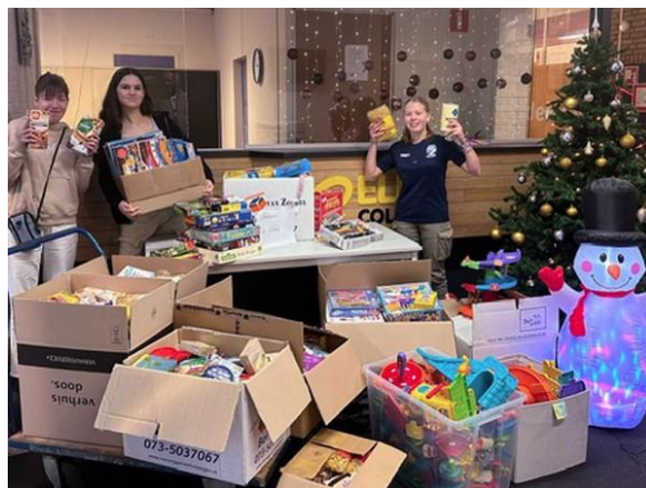
Leerlingen van het Eldecollege in Sint-Michielsgestel zamelen levensmiddelen in voor de Kerstactie van Vincentius